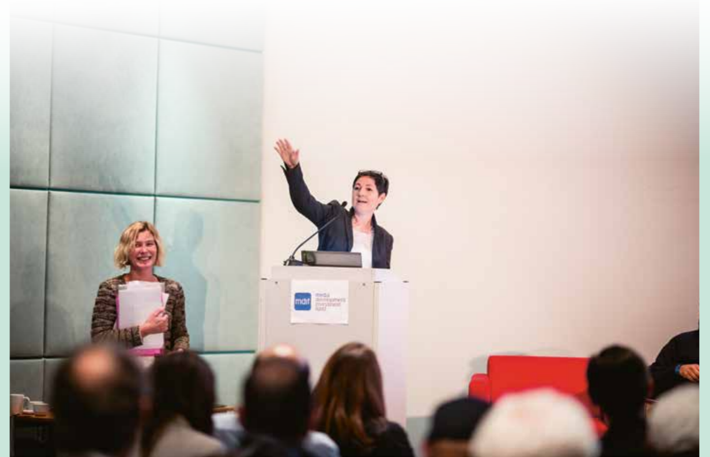
Majka at Media Forum Prague 2016

Het voelde letterlijk als een lot uit de loterij toen de Postcodeloterij – de Zweedse, Duitse, Britse en Nederlandse afdeling – de dag na de Russische invasie een do-