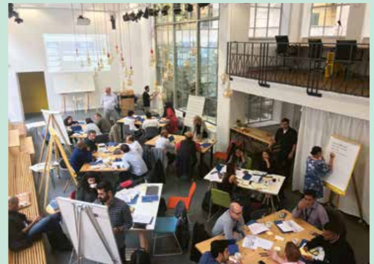
2 Ukrainian clients in discussion Media Forum 2019